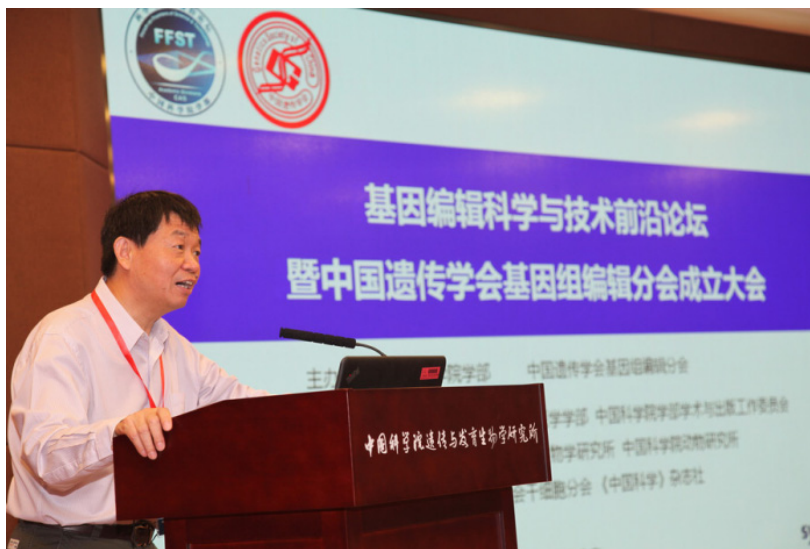
图 2 李家洋在中国遗传学会基因组编辑分会成立大会上发言

为推动我国基因编辑技术研发及其在生命科学基础研究、农业畜牧业育种以及基因治疗等医学领域的应用,防范其可能带来的生物安全风险和伦理争议,提升我国在基因编辑相关科学前沿、重大应用及下游产业化等领域的国际竞争力,2016 年 6 月,国家科技部发起召开了“香山科学会议—基因编辑技术的研究与应用”,针对我国基因编辑研究现状和所面临的机遇和挑战进行了探讨。2017 年 9 月,中国首个基因组编辑学术团体—中国遗传学会基因组编辑分会在北京成立,中国遗传学会名誉理事长李家洋担任大会主席(图 2),该学会的成立为从事基因编辑研究的学者提供了良好的学术交流平台。2018 年 4 月,第一届基因编辑技术方向的冷泉港国际会议:“冷泉港亚洲会议—基因组编辑全面讨论”于苏州召开,来自世界各地的科学家就基因编辑的最新研究进展开展了广泛而深入的讨论。